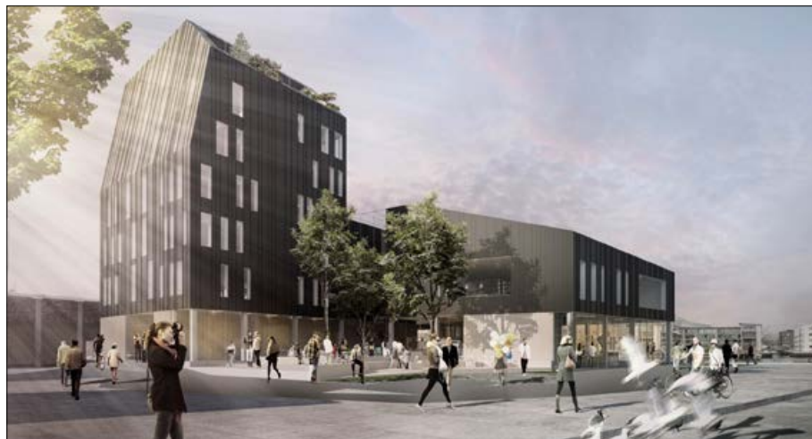
Projekttegning v. arkitekterne Cornelius+Vöge og Isager Arkitekter.

Nordatlantisk Hus er et åbent tilbud til alle, og håbet er, at rigtig mange