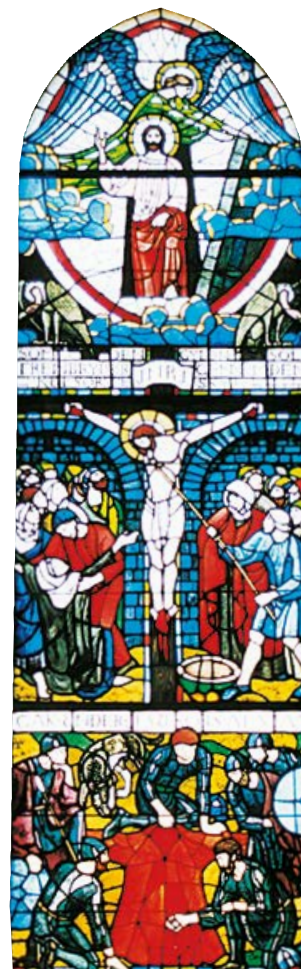
Parti fra alterrude. Joakim Skovgaard 1923

Kirkekørsel ved henvendelse til kirkekontoret tlf. 66 12 56 57 fredag ml. kl. 9.00 og 13.00. Der tages forbehold for ændringer i gudstjenestelisten.