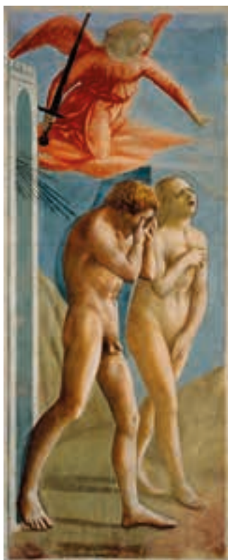
Masaccio, Uddrivelsen, o. 1425. Santa Maria del Carmine, Firenze.