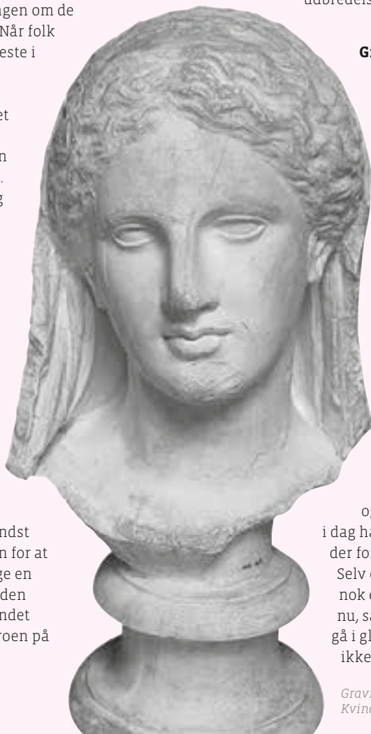
Gravrelief, fragment: Kvindehoved med slør. smk.dk

Selv om kvinders valgret i Danmark nok er blevet en selvfølgelighed for os nu, så skal den ihukommes. Det må ikke gå i glemmebogen, at ligeværdighed ikke altid har været nogen selvfølge.