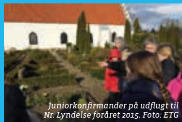
Juniorkonfirmander på udflugt til Nr. Lyndelse foråret 2015.

Se venligst i teksten herover. Vi glæder os! Tilmelding til kirkekontoret, thomaskingos.sogn@km.dk eller 66 12 56 57.