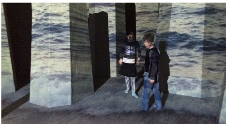
Der gås på vandet - til sanseudstilling på Brandts i 2017

Fiskeren Peter er ked af ikke at fange noget. Han bliver sur på sig selv. Men så kommer der en fremmed forbi. Han giver Peter et godt råd. Og der bliver fest.