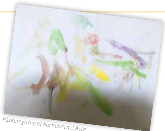
Påsketegning af barnebarnet Asta